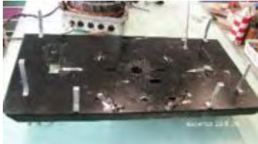
entfernte Chassisplatte mit den 2 Magazinrasten

Als Zwischenergebnis dieser Arbeit, können wir nun die gesamte Chassisplatte von der Mechanik abheben. Wer will, kann die darauf verbliebenen 2 Magazinrasten ebenfalls entfernen, hier achte man darauf, dass man die Federn nicht überdehnt beim Demontieren.