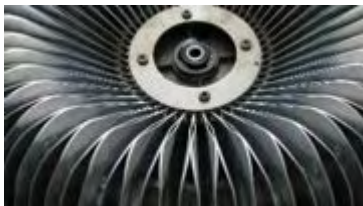
Abdeckungsring am Plattenkorb

Zuerst wird der Abdeckring, welcher mit 4 Schrauben am Plattenkorb befestigt ist, entfernt und danach wird mittels eines großen Schraubendrehers der Klemmring entfernt, ebenso die darunter liegende U-Scheibe. Wir merken uns die Position des Plattenkorbes ( am besten ein Foto schießen )und heben diesen vorsichtig von der Welle ab. Dabei entsteht ein klickendes Geräusch durch den unter Federspannung stehenden Rasthebel.