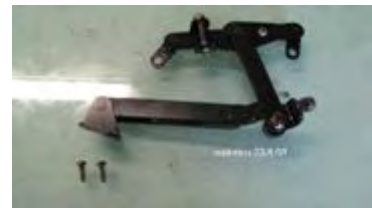
ausgebautes Gestänge "Waage"

Die Demontage des Hauptzahnrades ( zusammengesetzt aus 2 Zahnrädern ) erfolgt durch das Heraustreiben des Schwerspannstiftes aus der Buchse mit der Feder. Zuerst muss jedoch noch der Sicherungsring von der Welle demontiert werden ( in der Original Werkzeichnung ist dieser nicht eingezeichnet ). Mit einem Splintentreiber 3,5mm wird der Splint vorsichtig ausgetrieben. Wer keinen Splintentreiber besitzt, kann alternativ dazu einen entsprechenden Hartmetallbohrer zweckentfremden. Wie schon öfters bemerkt, sollte auch hier zuerst eine Markierung an der Welle und der Buchse angebracht werden. Jetzt kann die Buchse mit Feder von der Welle abgezogen werden und man sollte darauf achten, dass die beiden Filzringe am Ende der Feder nicht beschädigt werden beim zerlegen. Gehen diese doch kaputt, oder sind bereits kaputt, dann müssen sie ersetzt werden, oder was eher üblich ist, aus Pressfilz oder Leder hergestellt werden, da Original Filzdichtungen leider nicht erhältlich sind. Die untereinander vernieteten Zahnräder sollten nicht demontiert werden, außer es sind Beschädigungen vorhanden.