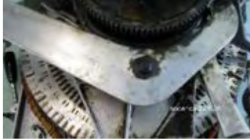
der eingebaute, große Hebel

Als nächstes werden die Steuerhebel demontiert, zuerst der große und anschließend die Doppelkombination. Der Grosse Hebel ist durch einen Spannring und einer U-Scheibe auf dem Lagerbolzen montiert, demzufolge also diese Teile abbauen.