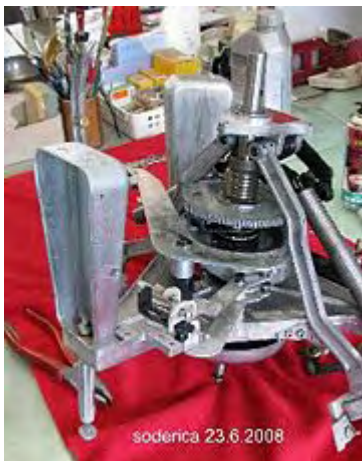
die gereinigte und zusammengebaute Mechanik

Im Normalfall, wird bei dieser großen Revision auch gleich noch die Junktion Box gereinigt-zerlegt, ebenfalls die Zerlegung und Reinigung des Mechanikbogens mit dem Plattentellerantrieb. Dieses ist aber ein Thema, dem ich mich, oder vielleicht ein anderer, in absehbarer Zeit widmen werde.