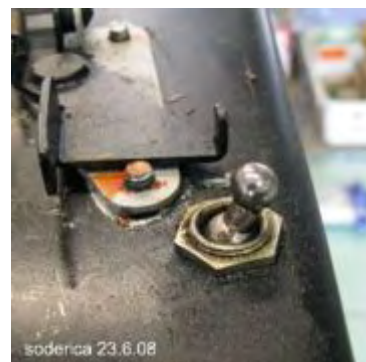
6-kant Mutter entfernen