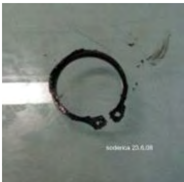
Sicherungsring der MainCam

gut zu erkennen der Distanzring aus Messing, darunter das aus 3 Einzelteilen bestehendem Kugellager