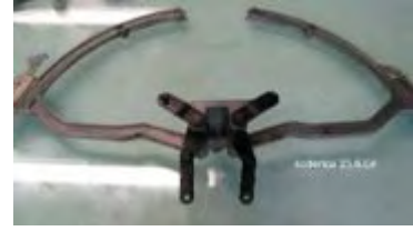
Hebearmeinheit im ausgebaut