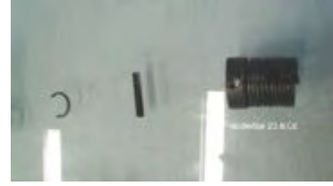
Sicherungsring, Spannstift und Hülse

Das Zahnrad wird nun so verdreht, dass die Bohrung mit der darunterliegenden Kreuzschlitzschraube überein stimmt. Und nochmals, auch wenn es langweilig erscheint, unbedingt mit Reissnadel markieren und die entfernten Teile in die Strichliste aufnehmen. Die Schraube kann nun gelöst-entfernt werden, dazu wird die unterhalb der Kurvenscheibe angebrachte Mutter mit Sicherungsring festgehalten.