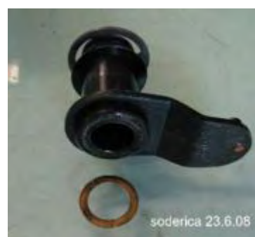
ausgebauter Mitnehmer mit Unterlegscheibe