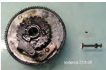
abgebautes Zahnrad mit Klinke und Schraube

Nach dem die Mutter und Sicherungsring entfernt sind, drücken wir die Schraube von unten nach oben und entnehmen sie aus der Bohrung. Anschließend wird die Rastenkombination seitlich herausgezogen und das Zahnrad kann von der Welle entfernt werden. Direkt darunter befindet sich noch eine U-Scheibe aus Messing, welche ebenfalls entfernt wird.