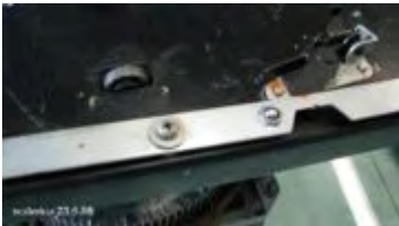
Wählhebel mit Schalter

Im nächsten Schritt demontieren wir den Hebelarm mit dem darunter befindlichen Schalter und die mit Kabelschellen montierten Drähte.