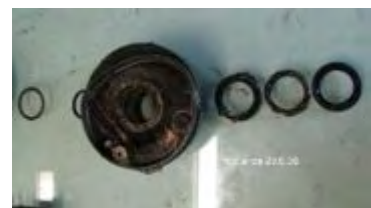
abgenommene Kurvenscheibe mit dem Kugellager