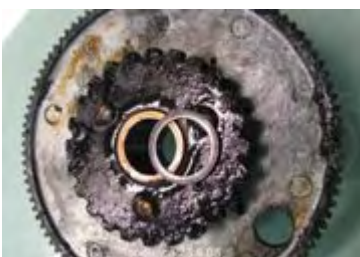
ausgebautes Zahnrad von unten gesehen, mit U-Scheibe