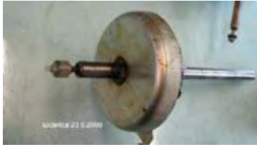
Plunger unterhalb der Glocke