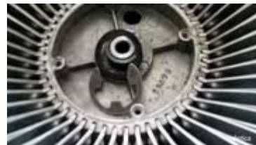
Sicherungsring und U-Scheibe des Plattenkorbes