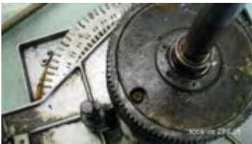
ausgerichtetes Zahnrad vor dem Entfernen der durchgehenden Schraube

Das Zahnrad wird nun so verdreht, dass die Bohrung mit der darunterliegenden Kreuzschlitzschraube überein stimmt. Und nochmals, auch wenn es langweilig erscheint, unbedingt mit Reissnadel markieren und die entfernten Teile in die Strichliste aufnehmen. Die Schraube kann nun gelöst-entfernt werden, dazu wird die unterhalb der Kurvenscheibe angebrachte Mutter mit Sicherungsring festgehalten.