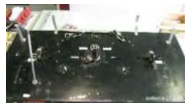
Chassisplatte ohne Plattenkorb