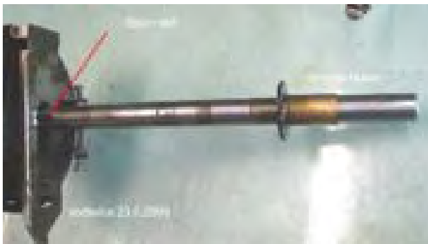
Ausgebaute Welle mit Bronzelagerbüchse

Nachdem noch die Bronzebüchse von der Welle entfernt wurde, erfolgt als letztes die Demontage des Plungerstiftes. Leider habe ich davon keine Fotos, respektive zwar gemacht, aber dummerweise gelöscht. Somit dient zur Verdeutlichung die Schnittzeichnung der Plungereinheit und ich denke der Aufbau ist gut erkennbar, auch für den Laien. Damit der Spannstift ausgetrieben werden kann, legt man die Welle mit der Glocke auf eine Unterlage aus Holz und klopft den Spannstift ganz vorsichtig heraus, ohne dass er gestaucht oder beschädigt wird. Achtung, die darin eingesetzte Feder drückt den Plungerstift auseinander und hier sollte man darauf achten, dass nichts wegfliegt.