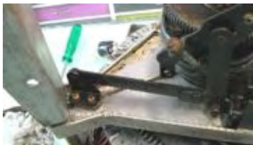
Kreuzgestänge "Waage" vor dem Ausbau

Nun erfolgt die Demontage des 2 Teils der Hebemechanik, welche mit 2 kreuzschlitzschrauben auf der Konsolenplatte verschraubt ist. Nach dem Entfernen der beiden Schrauben und Klemmrings, kann der Arm mit Gefühl aus dem Stehlager und unter der Kurvenscheibe heraus gezogen werden. Keine Gewalt anwenden, sondern lieber das Stehlager abbauen, dann geht es um einiges leichter.