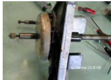
der letzte Sicherungsring auf der Welle v. der Junction Box demontierte Konsole mit Welle