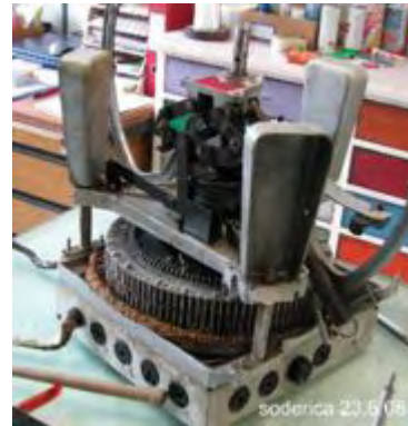
Mechanik ohne Chassis

Jetzt können wir als erstes die 2 Kontaktsätze des Mute-Play Switch entfernen mit dem daran gelöteten Schalter des Hebelgestänges. Hierbei ist besonders darauf zu achten dass das Schutzblech entsprechend mit abgeschraubt wird.