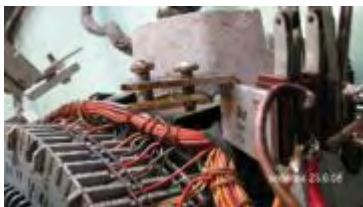
das unter dem Kontaktsatz angebrachte Schutzblech