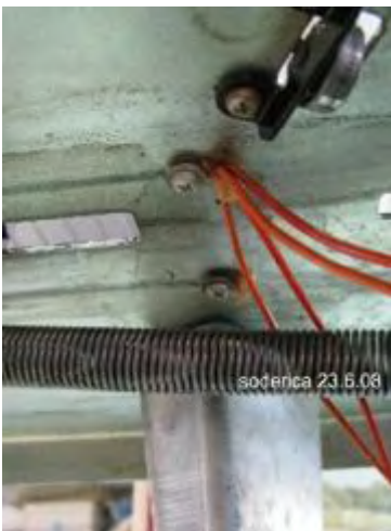
entfernen der 3 Kabelbriden