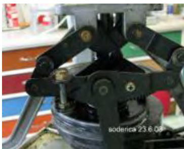
Das Kreuzhebelgestänge vor dem Ausbau

Widmen wir uns nun dem Gestänge, welches aus 2 Baugruppen besteht. Links und rechts sind 2 drehbar gelagerte Gestängehebel, welche mittels Sicherungsring und U-Scheibe mit dem anderen Teil des Hebelmechanismus verbunden sind. Die beiden Hebel werden somit als erstes gelöst in dem die Sicherungsringe-U-Scheiben entfernt werden. Die so freigegebene Hebearmmechanik wird anschließend von der Welle gezogen, dass darin befindliche Kugellager ebenfalls.