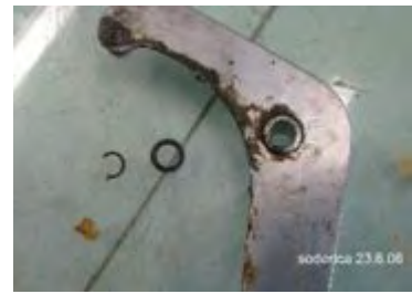
abgebauter Arm, daneben Sicherungsring

Im nächsten Schritt erfolgt der Ausbau des Doppelhebelarms. Dieser wird durch eine Inbusschraube an der Grundplatte gehalten. Beim Ausbau darauf achten, dass die darin befindliche Lagerhülse nicht verloren geht.