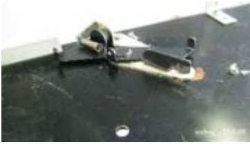
die 2 Magazinrasten werden markiert

Nachdem der Plattenkorb entfernt ist, Markieren wir die genaue Position der beiden Armführungen und der Magazinrasten mit einer Reissnadel. Diese Markierung verhilft uns beim Zusammenbau die erste Grobeinstellung, respektive müssen wir mit etwas Glück gar keine Justierung vornehmen, wenn die Teile wieder an der richtigen Position montiert sind.