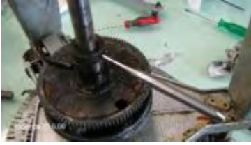
Hülse mit Feder über dem Zahnrad