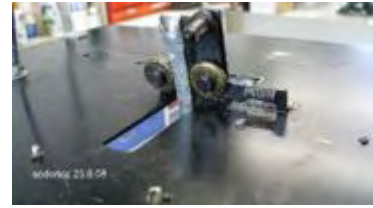
Markieren der Armführungen

Im nächsten Schritt demontieren wir den Hebelarm mit dem darunter befindlichen Schalter und die mit Kabelschellen montierten Drähte.