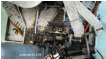
die Mute-Play Swicht Verschraubung von oben betrachtet

Jetzt können wir als erstes die 2 Kontaktsätze des Mute-Play Switch entfernen mit dem daran gelöteten Schalter des Hebelgestänges. Hierbei ist besonders darauf zu achten dass das Schutzblech entsprechend mit abgeschraubt wird.