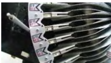
Vor dem Entfernen Markierung anbringen