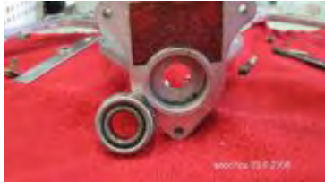
Hebearmkonsole mit Kugellager

Nun erfolgt die Demontage des 2 Teils der Hebemechanik, welche mit 2 kreuzschlitzschrauben auf der Konsolenplatte verschraubt ist. Nach dem Entfernen der beiden Schrauben und Klemmrings, kann der Arm mit Gefühl aus dem Stehlager und unter der Kurvenscheibe heraus gezogen werden. Keine Gewalt anwenden, sondern lieber das Stehlager abbauen, dann geht es um einiges leichter.