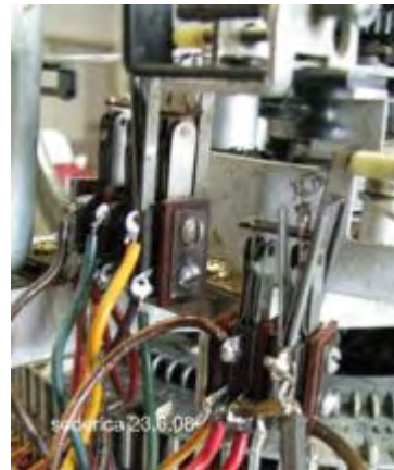
Mute und Play Switch Kontakte