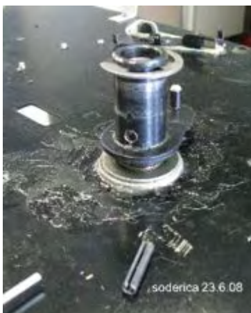
Mitnehmer für den Plattenkorb

Im nächsten Schritt entfernen wir mit einem Durchschlag 3,5mm den Mitnehmernocken von der Hauptwelle. Alternativ kann hier als Durchschlag auch 3,5mm Bohrer missbraucht werden. Treiben sie den Schwerspannstift mit leichten Schlägen von vorne gegen die hintere Seite mit dem Hebel. Zur Sicherheit markieren sie die Position vorgängig mit der Reissnadel.